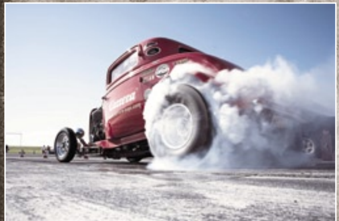
Davon können Slotcar-Fans nur träumen: Carrera-STREET-Hot-Rod beim Burnout