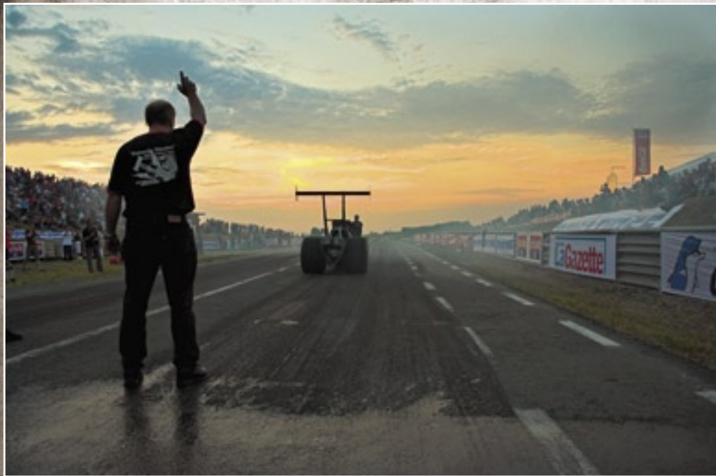
Schrei zum Abschied laut Servus: Dragster-Vorstart bei Sonnenuntergang