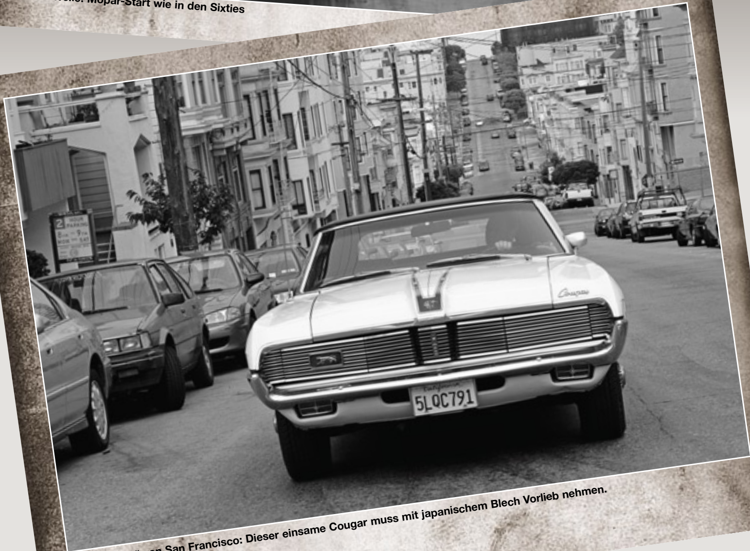
Die „Strafen“ von San Francisco: Dieser einsame Cougar muss mit japanischem Blech Vorlieb nehmen.