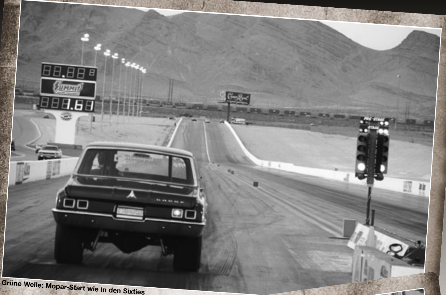
Grüne Welle: Mopar-Start wie in den Sixties