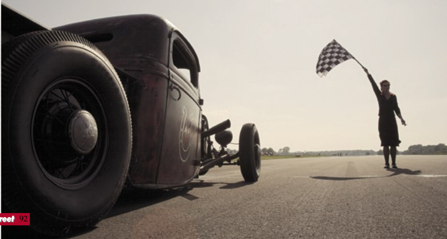
„Nein, ich bin nicht Roberta Flag!“ Flaggen-Girl kurz vor dem Launch

die Lucky Strike im Mundwinkel, den Pistenrand säumen. Der Flaggenmann hebt mit einem beherzten Sprung einen guten Meter vom Boden ab und reißt das karierte Tuch nach unten. Die Rauchschwaden, die beim Launch der Kontrahenten über die Piste wehen, würden wahrscheinlich selbst die Glut einer Lucky ersticken und so hält jedermann gebührenden Abstand.