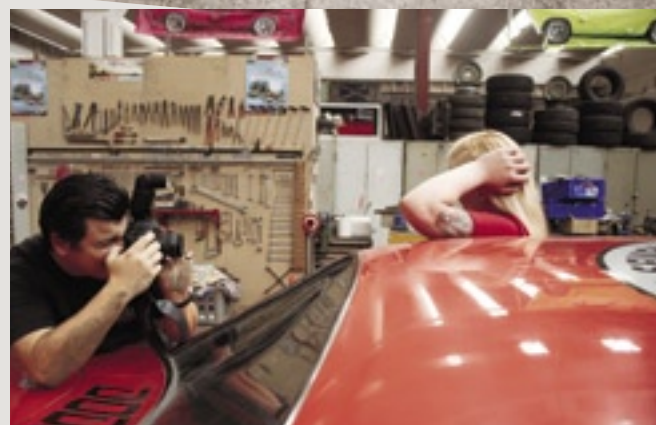
Adrenalin und Benzin: Rennatmosphäre von Dirk Behlau meisterhaft eingefangen