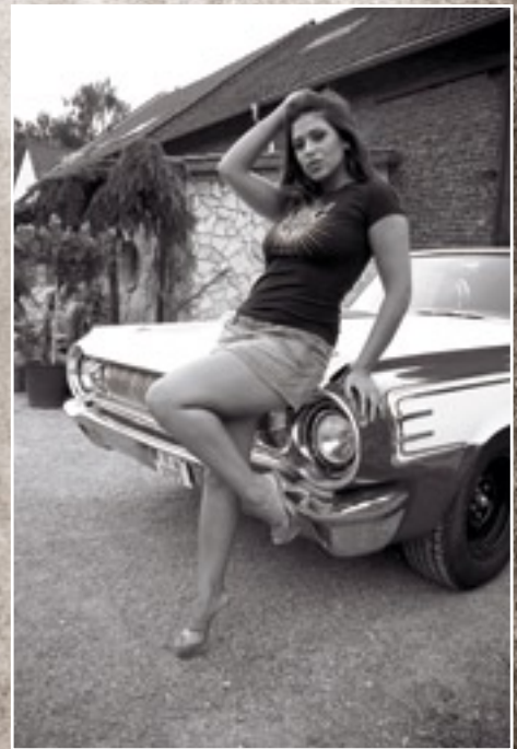
Mexican Chicano Chick? Fehlanzeige! Dieses Foto entstand in Köln!

um PS-starke amerikanische Autos und schöne Frauen geht“, so zog der Sender Resümee. Eine weitere Reportage folgt im Sommer dieses Jahres auf „Kabel 1“. Eine seiner besonderen Vorlieben hat dann auch in einem Fotoband Niederschlag gefunden, der ab dem Herbst 2007 bei einem bekannten Designbuchverlag weltweit erscheinen wird. Behlaus Liebe zur Old-School-Hot-Rod-, Mopar-, Dragster- und klassischen Pin-up-Fotografie wird hier durch Werke deutlich, deren authentische Ausstrahlung durch die oft ungewöhnlichen Perspektiven unterstrichen wird.