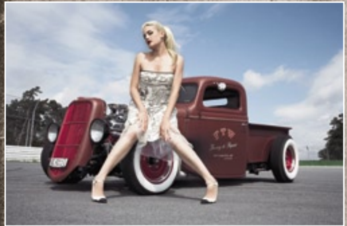
Lecker wie Schweizer Schoki: Schokobrauner Hot Rod Pickup aus Basel mit süßer Dekoration

Der Kölner Fotokünstler stammt ursprünglich aus dem Design-Bereich und schreibt und fotografiert obendrein auch für verschiedene Design/Lifestyle-Magazine. Selbst in Übersee hat Dirk bereits zahlreiche visuelle Projekte realisiert. Der deutsche Fernsehsender „VOX“ widmete dem Schaffen Behlaus überdies ein TV-Special, das im August 2006 ausgestrahlt wurde. „Dirk Behlau ist DER Fotograf in Deutschland, wenn es