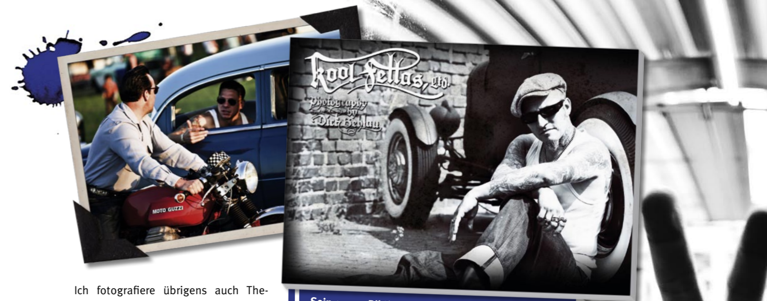
Sein neuer Bildband „Kool Fellas, Ltd.“ ist ab dem 29. Oktober 2010 erhältlich: www.koolfellas.com Bestellbar unter: www.szeneshop.com